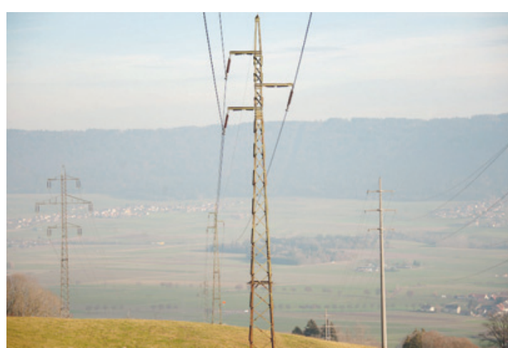
La tempête est à la base de la panne.

Dans le canton de Berne, la police a reçu une dizaine de coups de téléphone pour des arbres dé-